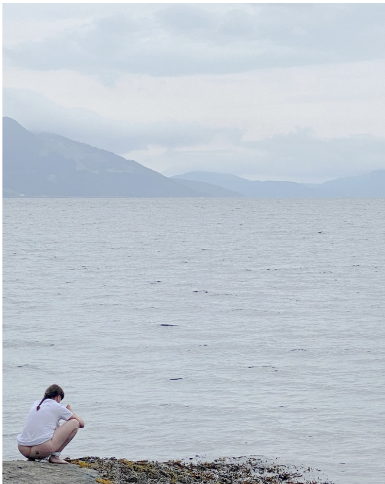
Kunstneren og Hardangerfjorden

- Der dreit jeg jo. Oppdrettsanlegg gir enormt mye kloakk. Dette var mitt bidrag til å vise det. Hardanger er navet i norsk nasjonalromantikk. Jeg fatter ikke at vi kan behandle natur og fjord som vi gjør.